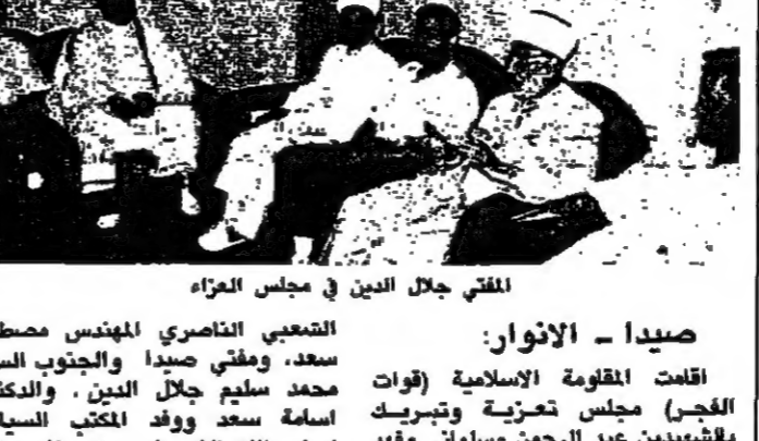
المفتي جلال الدين في مجلس العزاء

صيدا - الأناور: اقامت القومفة الاسلامية (قوات التحرير) مجلس عزبية وتبريك... اشعلت نشبته انفجار ثمة الخياط